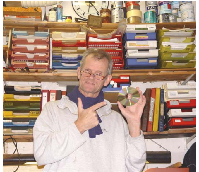
De ontdekker van niks