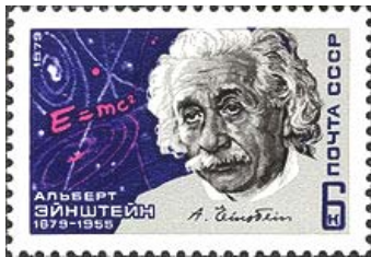
Einstein: 'in 't algemeen is alles bijzonder relatief'

Er bestaat geen middelpunt. Voorbeeld: wat is het middelpunt van een c.d.? Het gat in het midden? Nee, dat gat heeft een bepaalde afmeting. Je moet dus óók het midden van dat gat bepalen. Je legt de c.d. op een stuk papier en zet een punt in het midden van het gat.